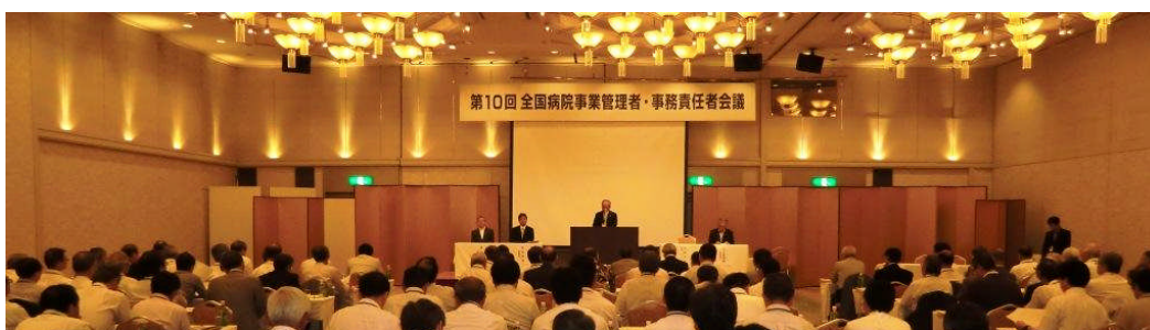
昨年度会議の様子(島根県開催)

多事多難な時局ではありますが、より多くの関係者にご参加頂き、涼しい青森で熱い議論を闘わせられればと願っております。何卒よろしくお願ひ申し上げます。