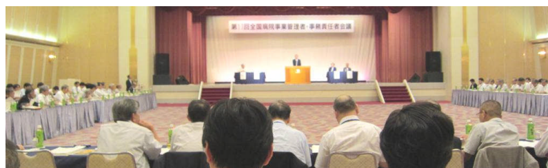
昨年度会議の様子(青森県開催)

お暑い中、ご多忙とは存じますが、より多くの方にご参加いただき、有意義な会議にしたいと考えております。何卒よろしくごお願い申し上げます。