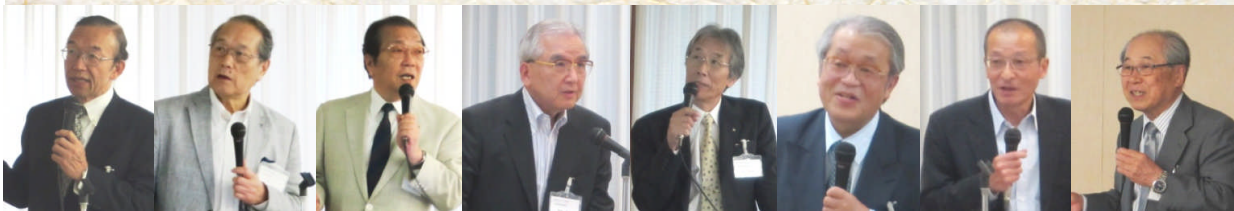
※ 写真は左からプログラム順